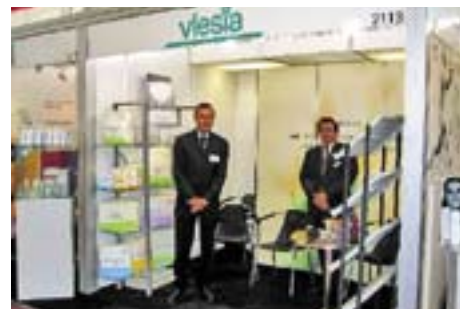
Présentation de Vlesia à la PLMA d'Amsterdam juste avant l'ouverture du salon.

Une raison suffisante pour Vlesia de participer pour la première fois à ce salon, afin de se positionner spécialement comme marque commerciale avec « quelque chose de spécial » et de mettre ses atouts en avant. Car Vlesia n'est pas seulement un distributeur – l'équipe de Vlesia, petite mais très flexible et engagée, accompagne personnellement chaque client avec professionnalisme et dans tout ce qui touche à la communication. Le MIS de Vlesia a attiré une grande attention et était tout à fait unique sous cette forme au salon. Vlesia est parvenu à éveiller l'intérêt de nombreux visiteurs et à prendre des contacts commerciaux très prometteurs au plan mondial avec de nouveaux clients. Mais beaucoup de fidèles clients de longue date ont également pu être accueillis sur le stand. Du fait de ce succès, Vlesia participera à nouveau en 2005 à la PLMA d'Amsterdam (les 24 et 25 mai).