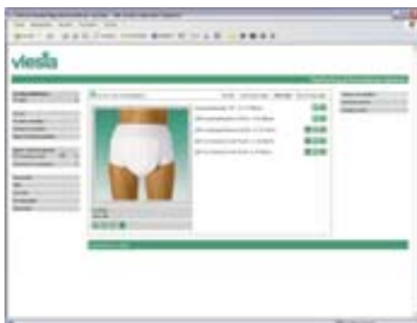
Avec le MIS de Vlesia ( http://mis.vlesia.info ) vous créez avec rapidité et confort vos propres supports marketing.